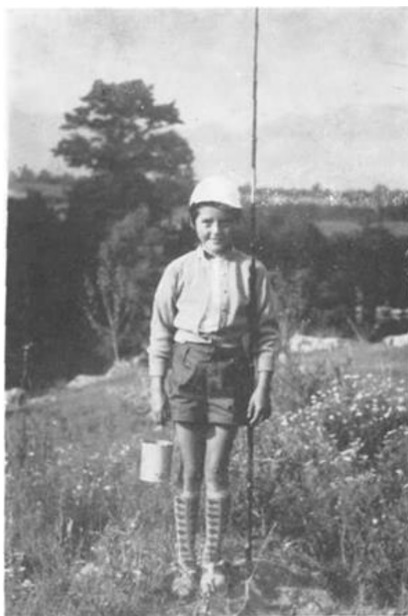
... prva pionirka takmičarka u Gospiću 1957. godine