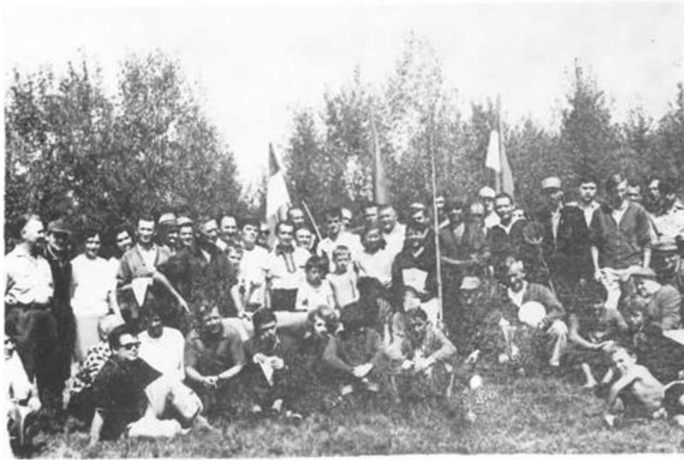
Članovi »Drave« na međudruštvenom natjecanju