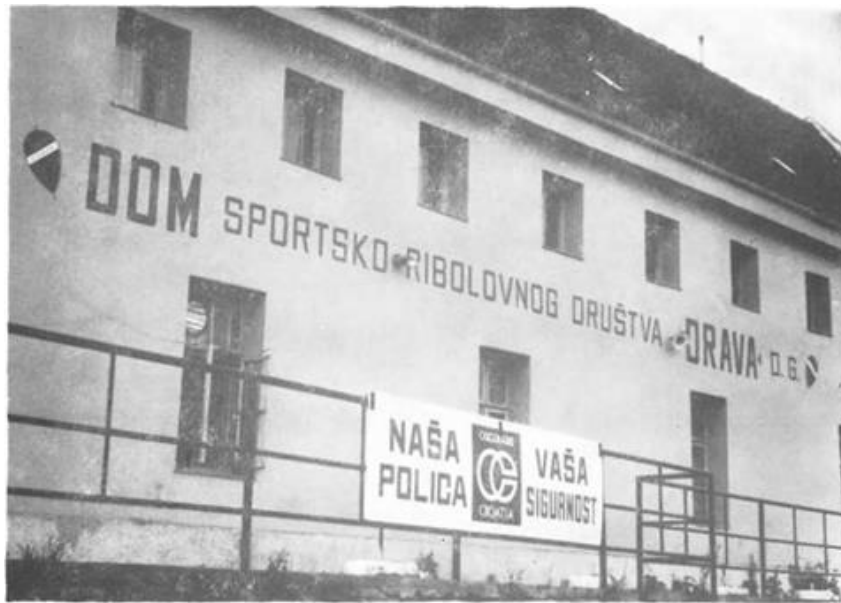
Društveni dom SRD »Drava« nakon obnove