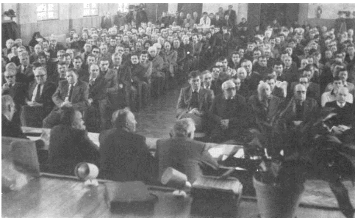
Izborna skupština SRD »Drava« 1981. godine