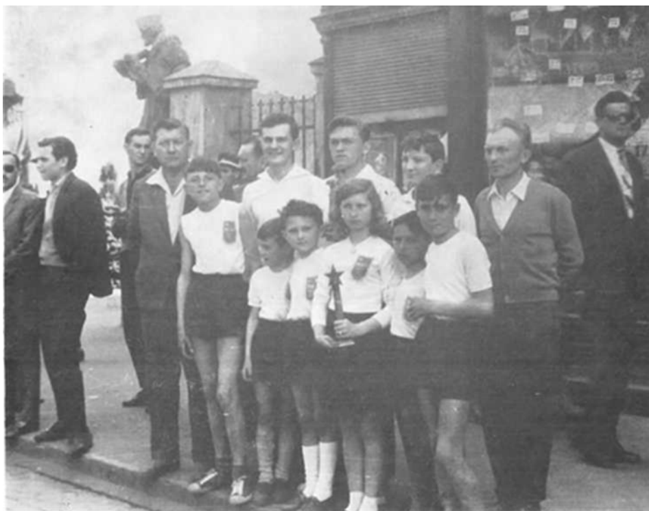
Učešće članova SRD »Drava« u štafeti

Za prijem u članstvo pionira sportskih ribolovaca postojali su dosta strogi kriteriji. Član pionir je mogao postati tko nije navršio 14 godina, ako je imao pismeno odobrenje roditelja, ako je bio dobar učenik i aktivan u svojoj školskoj pionirskoj organizaciji, te da je dobrog vladanja i da zna ili