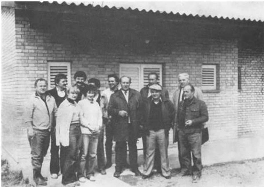
Otvaranje vikend-kućica na Ušću 1983. godine