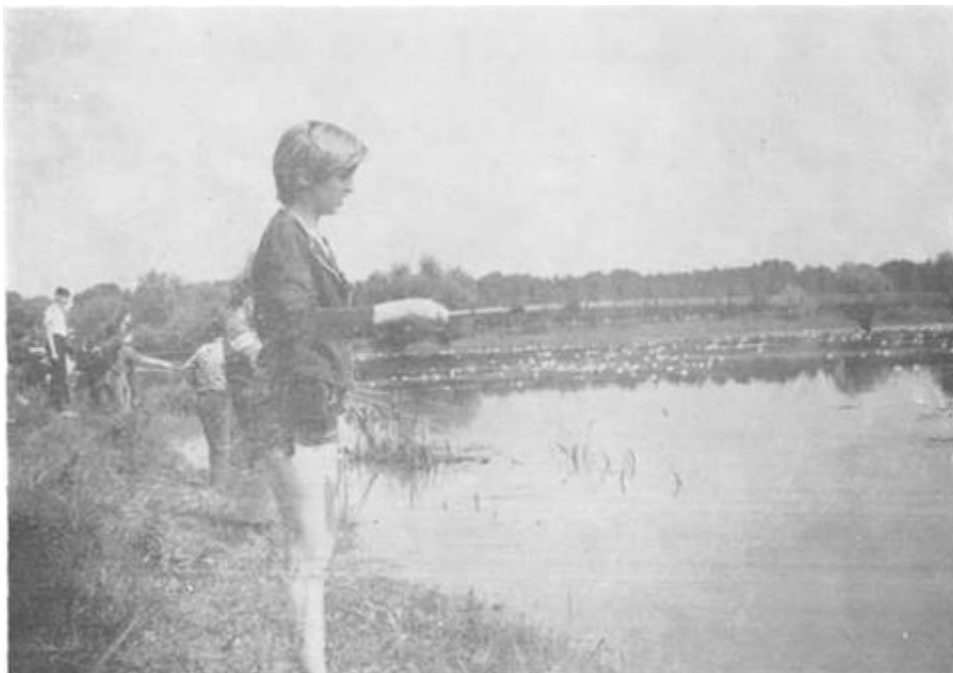
Natjecanje pionira u lovu ribe udicom na plovak

Godine 1968. uvedeno je blinkersko takmičenje u lovu ribe, koje se održava u određene godine kao i memorijal u čast dugogodišnjem i zaslužnom članu SRD »Drava« Detling Viktora. Na takmičenju je učestvovalo 187 seniora, 15 omladinaca, 3 omladinke, 25 pionira i 4 pionirke.