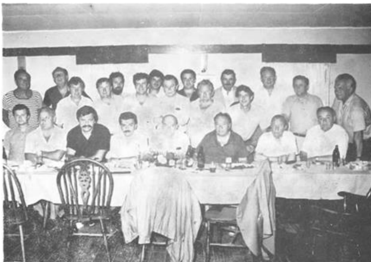
»Okrugli stol« održan u prostorijama SRD »Drava« 1986. godine

Prvih poratnih godina bio je problem nabaviti pribor za sportski ribolov i natjecanje. Stoga je Društvo nabavljalo pribor po tvorničkim cijenama i tako snabdjevalo svoje članove sportskim priborom. Kasnije, kad su trgovine bile dovoljno opremljene sportskim priborom, prestaje Društvo o tome brinuti.