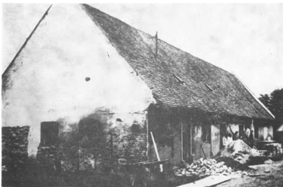
Radovi na društvenom domu u Osijeku

Ideja o gradnji objekata izvan Osijeka pala je još daleke 1951. godine. Ona je potekla iz potrebe, jer je već tada grad bio pun dima i buke, a čovjek je tražio malo mira i odmora u tišini prirode i kraj vječne vode. Kao najpogodnije mjesto izabrano je ušće rijeke Drave u Dunav koje su ribiči dobro osjetili, jer oni imaju dobar »nos«. To je mjesto tada bilo prostrano, obraslo starim drvećem i plavljeno od vode.