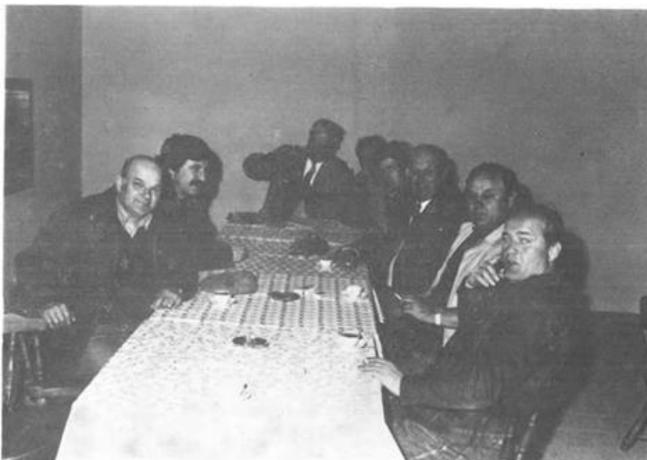
Svečana sjednica Izvršnog odbora SRD »Drava« Osijek na ušću Drave povodom otvorenja novoizgrađenih vikend kuća

Od 1983. g. »Drava« razvija dobru suradnju s turističkim organizacijama u Osijeku i šire, pa su tako u desetak navrata posjetili objekte na Ušću gosti i sportski ribolovci i iz drugih zemalja, a dakako i velik broj domaćih gostiju. Oni su se ugodno osjećali uz kompletnu uslugu, od noćenja do ishrane u restoranu, u pravom sportsko-ribičko-rekreacijskom ambijentu. Takvo usmjerenje ribolovnog turizma znači jedan novi sadržaj i zaokret. To je ujedno doprinos i našoj konkretnoj stvarnosti u zemlji u pogledu stabilizacijskih kretanja, širenja ribolovnog turizma, propagiranje domaćih ljepota i kulturnih vrijednosti.