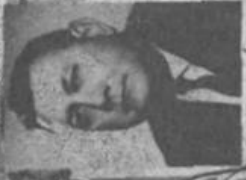
MIMIĆ A. PREDSJEDNIK

UPRAVNI ODBOR IZABRAN 1966. - 1968/69. GODINE