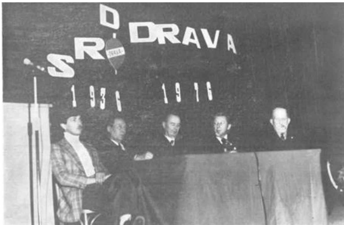
Proslava 40. godišnjice SRD »Drava«

I kao epilog svega rečenog dolazi 1986. godina, godina obljetnice koju je Društvo započelo na najljepši način. Naime početkom 1986. g. SRD »Drava« se »ponovilo« s oko 50 novih članova, jer je osnovana sekcija sportskih ribolovaca doma JNA u Osijeku. Ova se sekcija nalazi u sastavu SRD »Drava«, a jedan član sekcije ulazi u Izvršni odbor Društva.