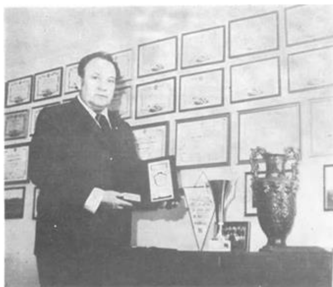
Dio brojnih društvenih priznanja - rezultat uspješnog rada