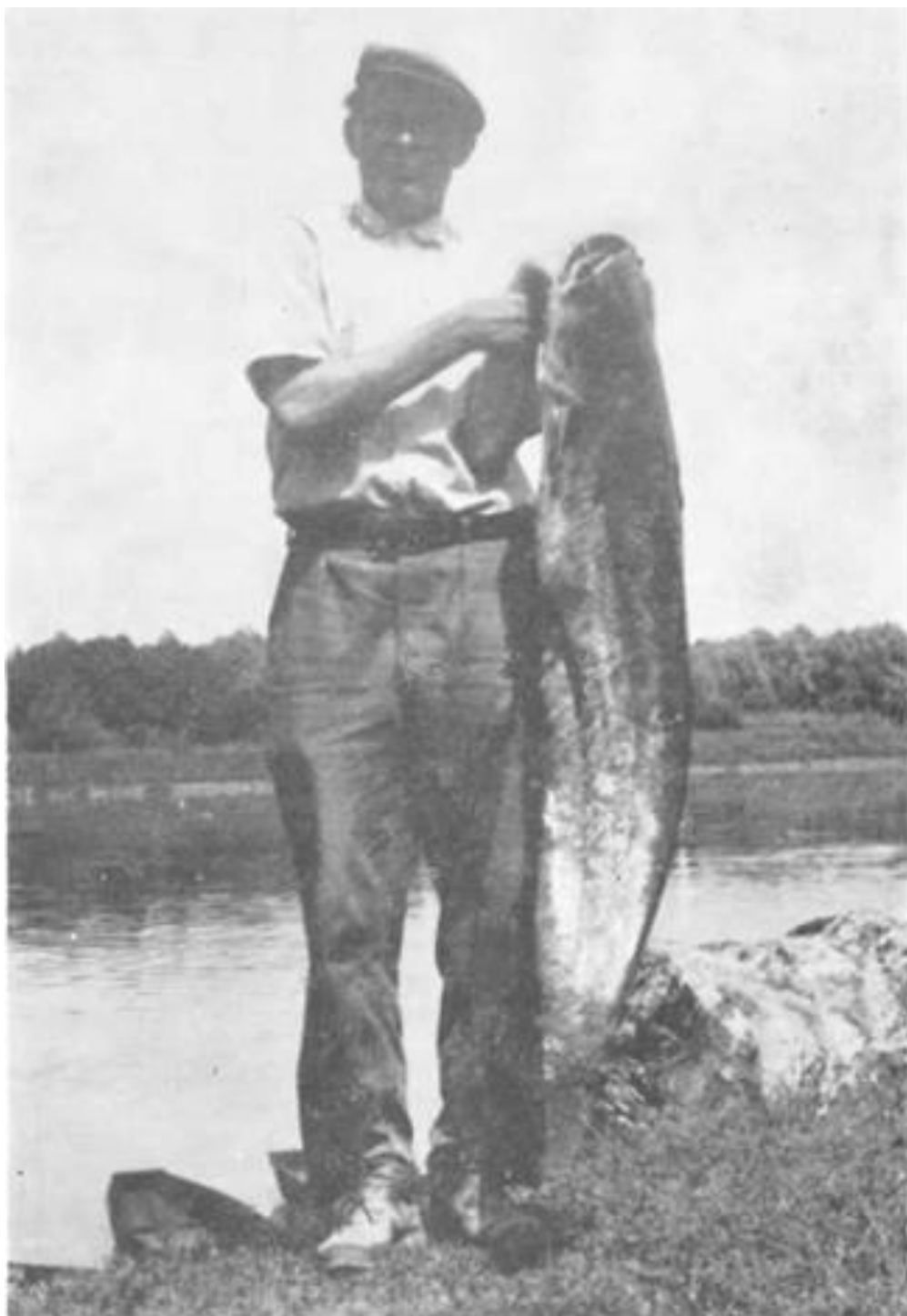
Rezultat uloženog truda — ugodan doživljaj za svakog ribiča