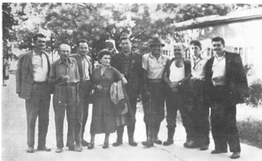
Takmičari na prvenstvu Hrvatske u Borovu 1957. godine