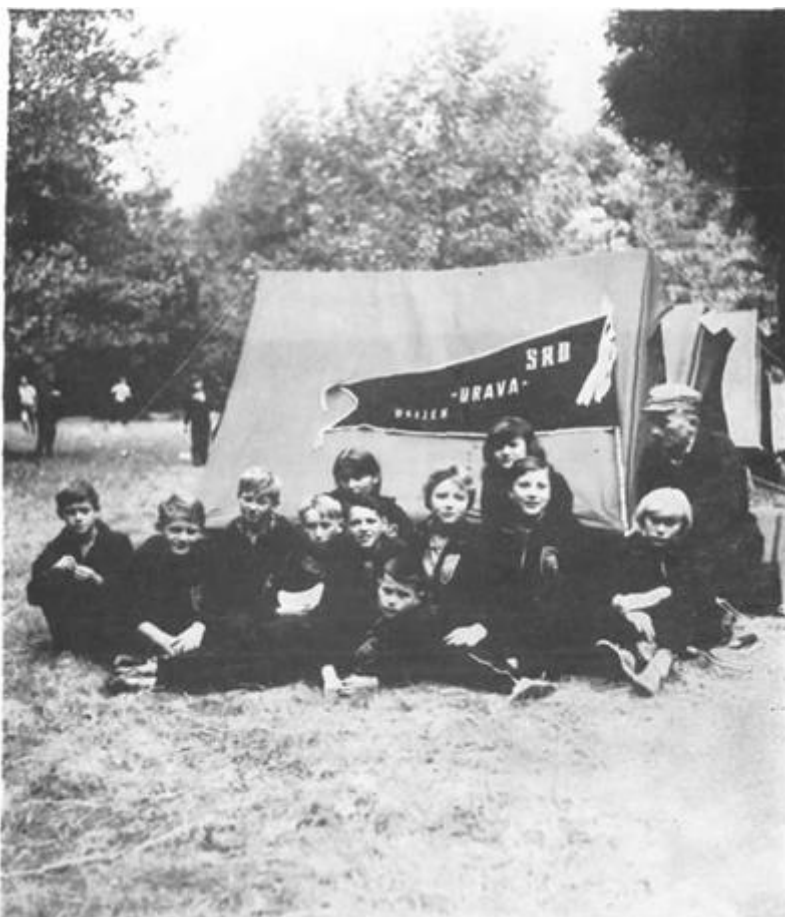
Slet pionira, ekipa SRD »Drava« Osijek