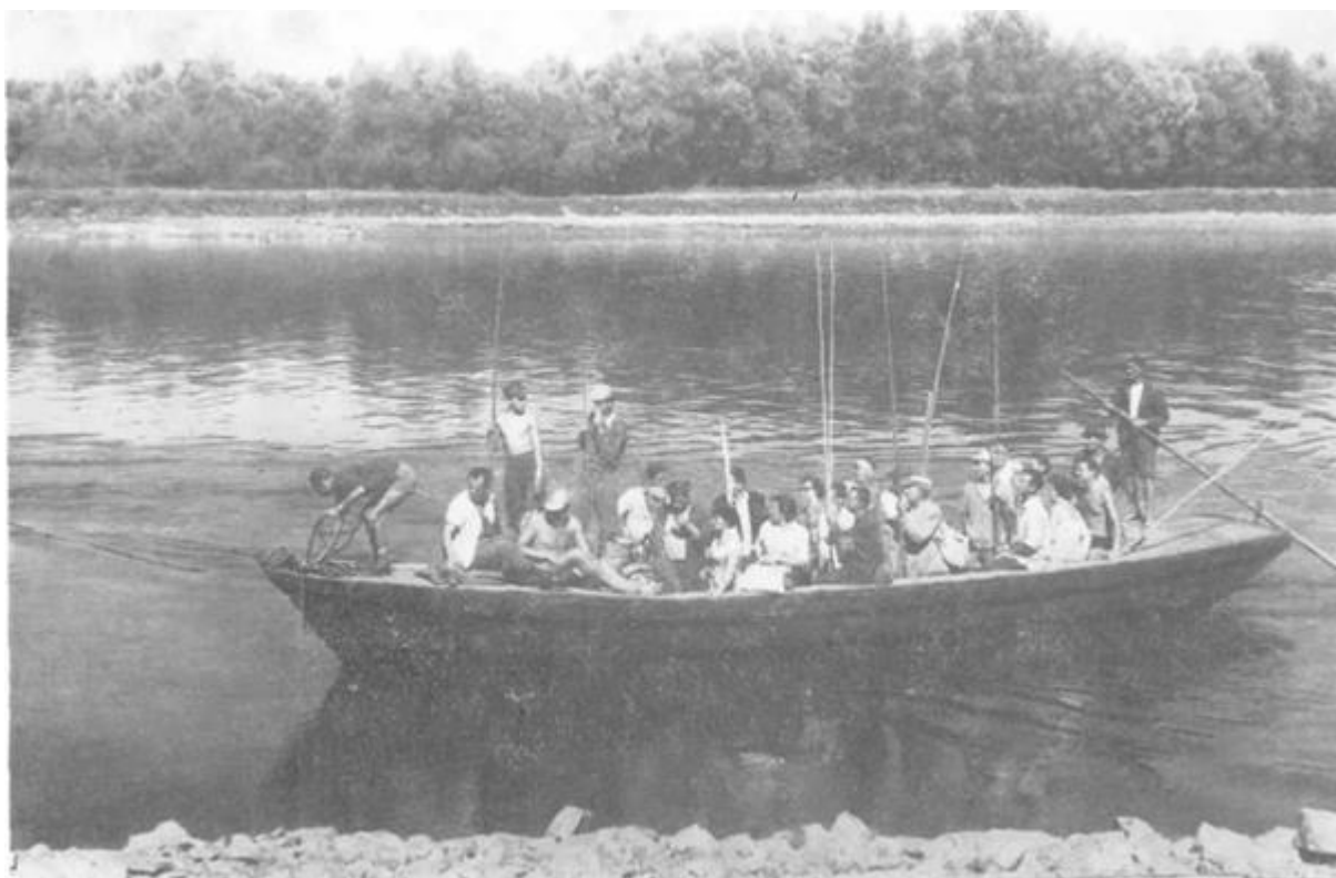
Izlet društvenim čamcem 1950-tih godina

Đaković« iz Osijeka pod vodstvom Hrvoja Biničkog. Već te godine u društvenom domu je priređeno 14 društvenih večeri uz ono »korisno s ugodnim i zabavnim«. Radovi na Ušću i na društvenom domu u Osijeku su privedeni kraju 1968. g. U njih je, osim materijalnih sredstava od 1964 - 1969. g. uloženo oko 456.687 n. d., kao i mnogo dobrovoljnih sati, truda i dovitljivosti samih članova SRD »Drava«, u prvom redu njegove uprave. Po dovršenju radova, Ušće su posjetili drug Jakov Blažević tadašnji predsjednik Sabora Hrvatske i Jure Ivezić, uz brojne društveno-političke predstavnike općine Osijek, koji su tom prilikom odali veliko priznanje SRD »Dravi«. Također valja naglasiti da su društvene prostorije u Osijeku koristila i koriste i druga društva kao npr. Centar SRD Osijek, LD Partizan i drugi.