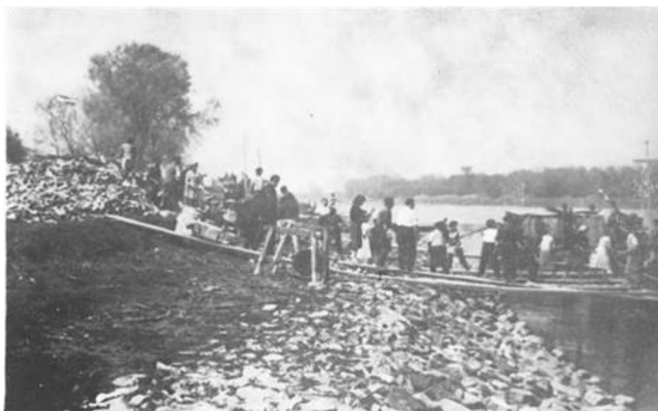
Početak radova na ušću Drave kod Aljmaša

Prema prvoj osnovi društveni dom je trebao biti baraka 4X2 m. No članovi upravnog odbora su isposlovali kod OLT-a otpisanu zgradu bivše škole učenika u privredi (to je bila predratna škola metalaca, inače prethodnik današnjeg EMŠC) za izgradnju doma uz simboličnu naknadu. Građa je rezana a potom sastavljena u krugu Šećerane, te kao sastavljena željezna konstrukcija transportirana na Ušće. Pri tome valja spomenuti posebnu pomoć što je kod ove gradnje pružala društveno-politička zajednica i radne organizacije Osijeka, naročito Općinsko sindikalno vijeće u Osijeku. Tokom 1954. g. sastavljen je montažni dom, a slijedeće godine je nabavljen namještaj, uređena okolina i zasađeno cvijeće. Dom je svečano otvoren 11. IX 1954. g. Mogao je primiti 30 osoba na prenoćište.