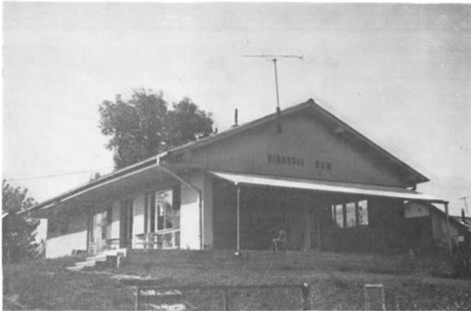
Moderni objekti SRD »Drava« Osijek na ušću Drave u Dunav

Kad je donesen Zakon o revalorizaciji osnovnih sredstava, izvršen je 1980. g. obračun osnovnih sredstava SRD »Drava«. Nova vrijednost objekata iznosila je 3,458.218 din., što predstavlja veliki materijalni potencijal i pruža solidnu materijalnu bazu za daljnji rad i razvoj na polju društvene djelatnosti, sportskih takmičenja, rekreacije, ribolovnog turizma i drugo.