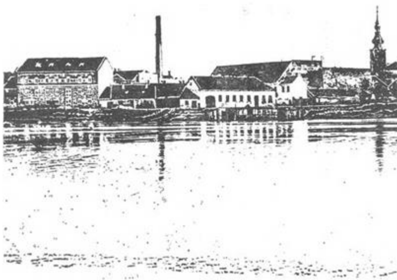
Osijek, Donji grad