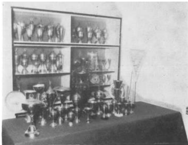
Dio brojnih pehara osvojenih na raznim takmičenjima

Vrijedno je istaknuti da su na godišnjoj Skupštini 1985. g. za članove Izvršnog odbora predloženi i izabrani delegati koji se nalaze u radnom odnosu a imaju do 50 godina života. To stoga što se željelo da članovi što aktivnije djeluju u radnim organizacijama te da s mlađim snagama aktiviraju još više rad. Tako je izabrano 15 delegata iz 12 velikih RO što daje garanciju za omasovijavanje i prisutnost sportskog ribolova u širokim slojevima radnika u Osijeku.